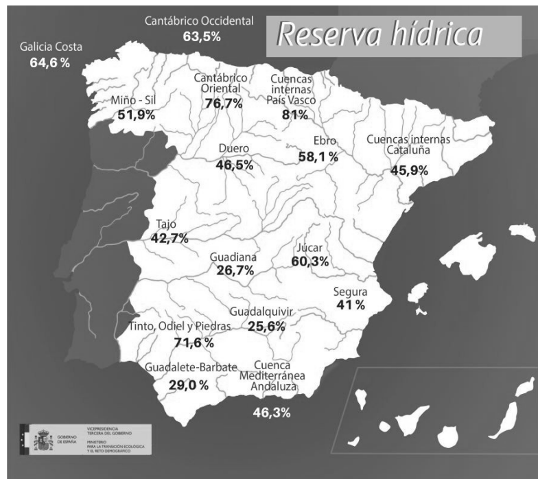
Ilustración 1 Reserva hídrica [Agropopular, 2022] 3

En el caso del agua embalsada, los embalses y pantanos cerraron el mes de julio al 37,9 %, su nivel más bajo en una década 4 , lo cual pone de manifiesto la situación delicada en la que se encuentra España para las próximas semanas y que exige la adopción de medidas eficaces para asegurar el abastecimiento de agua a todos los españoles.