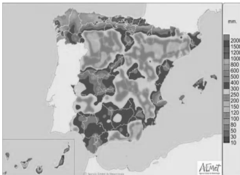
Ilustración 3 Precipitación acumulada en el año hidrológico. [AEMET, 2022] 11