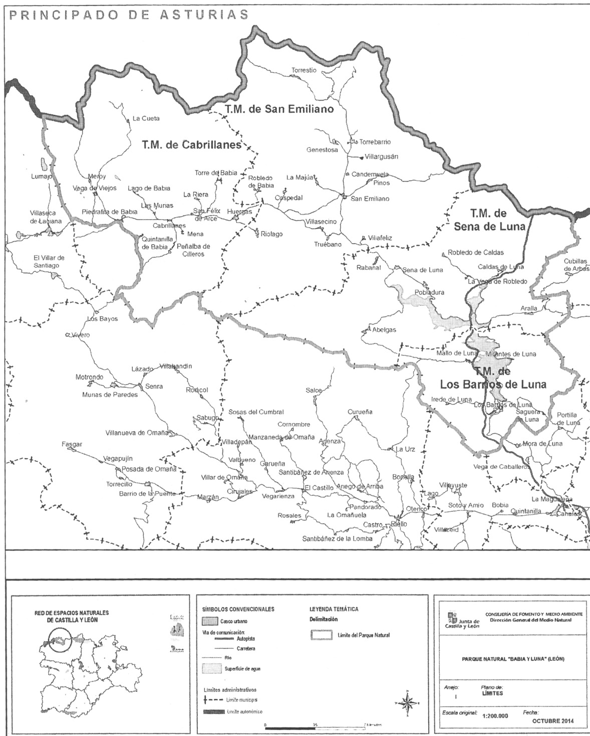
Plano de límites del Parque Natural "Babia y Luna" (León).